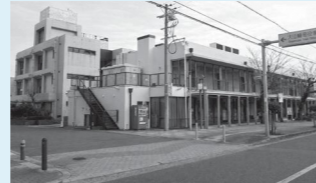
中央公民館解体前

また、令和8年4月現在。公民館の解体工事は完了し、発掘調査が6月まで実施される予定です。行政側案では、供用開始(オープン)は令和10年3月中とされていますが、議会として、事業費の増額が今後の計画全体に与える影響についても、引き続き注視していきます。