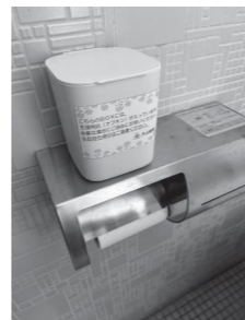
庁舎トイレ。学校にも生理用品を

低学年からの男女別の更衣室の設置、健診時の着衣を認めるなど、羞恥心に配慮した対応を求めるがいが。