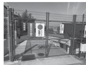
自転車も通れる通路整備が必要！

水道施設を通る通学路整備の予算は、議会での否決が続いている。他ルートの検討はしているか。昨年10月、通行についての覚書を神社と交わした。この覚書は、児童の通学に支障が生じぬよう整理した物である。しかし町が主体的に管理し、安全性・継続性を確保できる通学路を整備する事が望ましいと考えており、一貫して鳥居前配水池内を活用した通学路整備を目指してきた為、他ルートの検討はしていない。みやびヒルズへの進入路の足元灯が消えたままになっている。神社に改善を促す事を求めるかが。足元灯は神社が設置したものであり改善を強制できない。しかし当該地は通学路として利用している為、安全確保の観点から神社に伝え、可能な範囲で配慮を求める事はできると考えている。