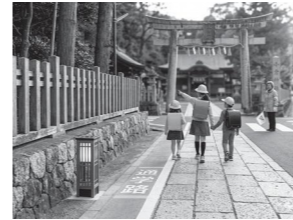
地域の目、小倉神社経由で守る

鳥居前地区の通学路整備について、新規事業として進める必要性と緊急性に疑問を呈しました。地域からは既存ルートの活用や通行許可の可能性も示されており、新たな整備ありきではなく、現行ルートの検証を優先すべきではないかと指摘しました。町は児童の安全確保を最優先とし必要な事業と説明。既存ルートは通行の継続性や安全面に課題があり、安定的な通学路として位置付けが困難とし、新規整備を進める考えを示しました。地域の協力により覚書まで交わしている中で、独自に恒久的整備を進めることは整合性や配慮に欠けるのではないかと指摘しました。地域とともに子どもを守るあり方を重視すべきであると考えます。