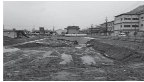
解体工事済の公民館跡地