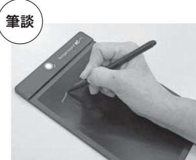
分かりやすくまとめて書く