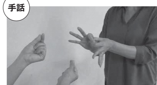
手指や体の動き、顔の表情や視線などを同時に使う「見てわかる言語」

町では、聞こえに障がいのある人もない人も、お互いの人格や個性を尊重し合い、ともに安心して自分らしく暮らせる共生社会を目指し、条例を制定しました。