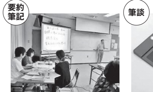
発言者の話を聞き、要約して書く